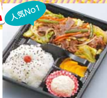
人気No1 ジングスカン 弁当 840円 (税込)