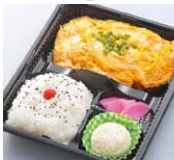
かつとじ弁当 840円 (税込)