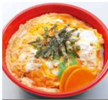
かつ丼 840円 (税込)