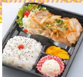
生姜焼き 弁当 790円 (税込)