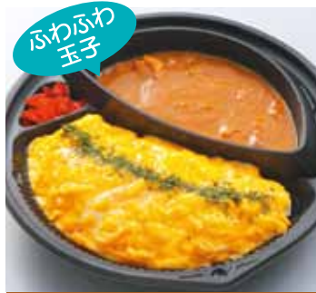
ふわふわ 玉子 オムカレー 840円 (税込)