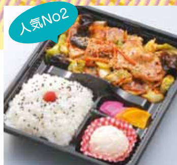
人気No2 ホイコーロー 弁当 820円 (税込)