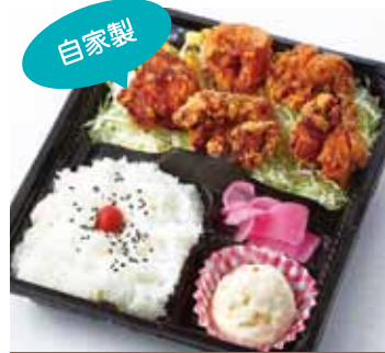
自家製 ザンギ弁当 790円 (税込)