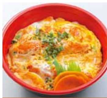
海老丼 790円 (税込)