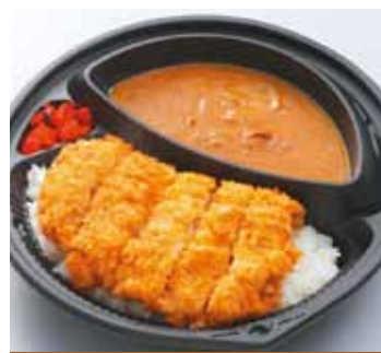
かつカレー 870円 (税込)