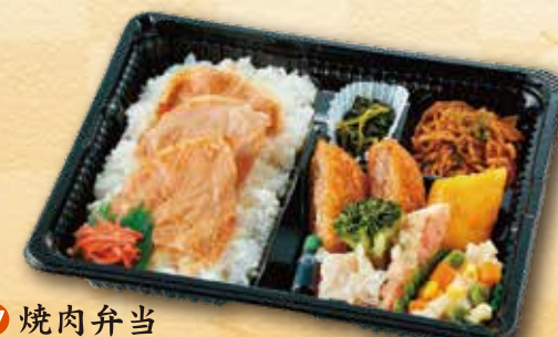
27 焼肉弁当 730 円 (18.5×22.0cm)