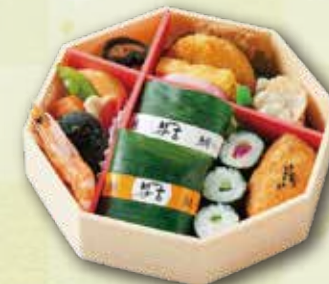
6 佳風<かふう> 1,300 円 (17.5×17.5cm)