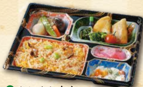
53 かにめし弁当 1,250 円 (21.5×26.5cm)