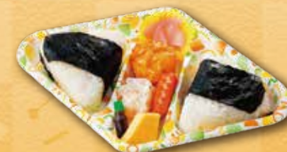
33 おにぎり弁当 550 円 (15.5×25.6cm)