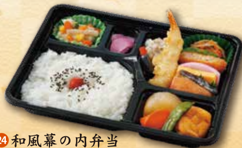
24 和風幕の内弁当 830 円 (19.5×26.0cm)