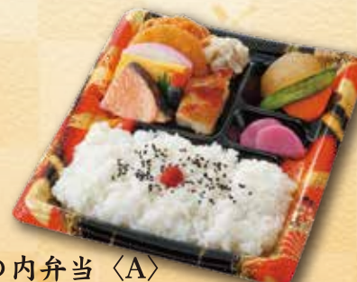
26 幕の内弁当〈A〉 730 円 (23.4×19.4cm)