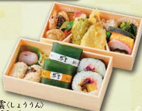
15 祥雲<しょううん> 2,000 円 (10.0×18.5cm)