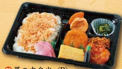
29 幕の内弁当〈B〉 630 円 (15.5×21.5cm)