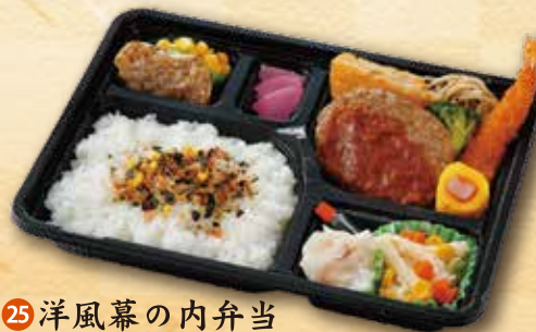
25 洋風幕の内弁当 830 円 (19.5×26.0cm)