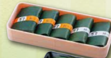
1 笹寿司 (5個入り) 900 円 (8個入り) 1,400 円