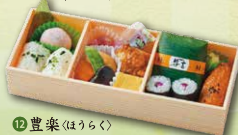
12 豊楽<ほうらく> 1,000 円 (9.6×24.6cm)