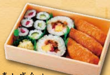
32 寿し盛合せ 550 円 (11.5×17.0cm)