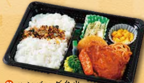
31 ハンバーグ弁当 630 円 (15.5×21.5cm)