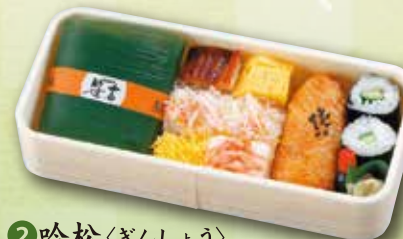
2 吟松<ぎんしょう> 700 円 (8.3×18.8cm)