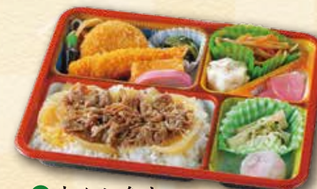
56 牛めし弁当 1,100 円 (18.5×23.0cm)