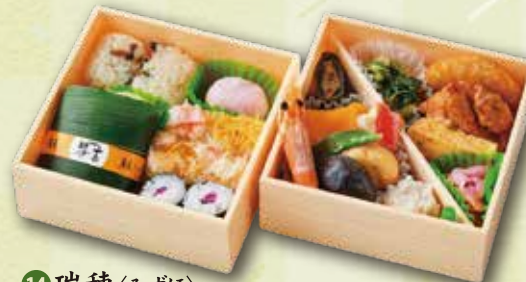
14 瑞穂<みずほ> 1,500 円 (12.5×12.5cm)