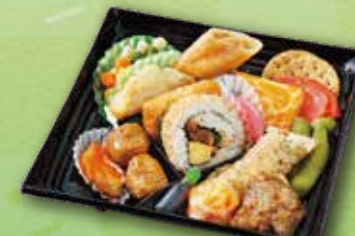
64 おつまみセット 1,100 円 (19.5×19.5cm)