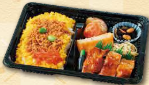
30 鶏そぼろ弁当 500 円 (15.5×21.5cm)