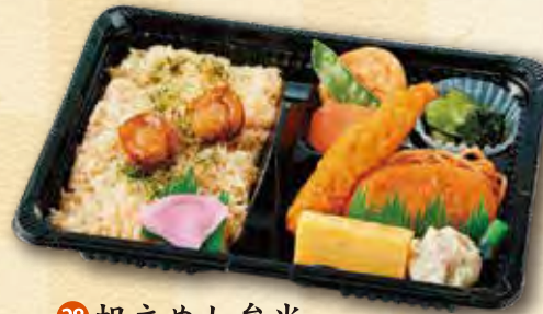
28 帆立めし弁当 600 円 (15.5×21.5cm)