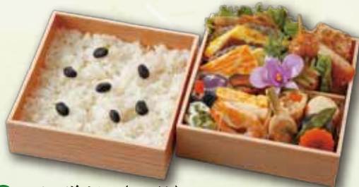
18 不祝儀折 <二段> 2,000 円 (15.0×15.0cm)