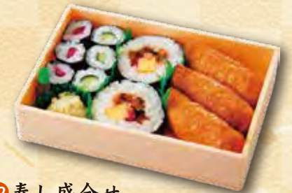
32 寿司盛合せ 460 円 (11.5×17.0cm)