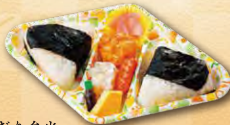
33 おにぎり弁当 460 円 (15.5×25.6cm)