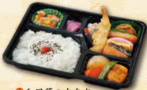
24 和風幕の内弁当 700 円 (19.5×26.0cm)