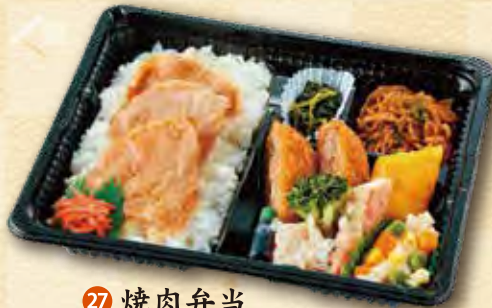
27 焼肉弁当 600 円 (18.5×22.0cm)