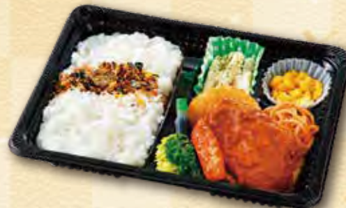
31 ハンバーグ弁当 500 円 (15.5×21.5cm)