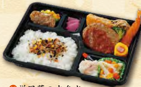
25 洋風幕の内弁当 700 円 (19.5×26.0cm)