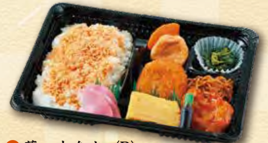
29 幕の内弁当〈B〉 500 円 (15.5×21.5cm)