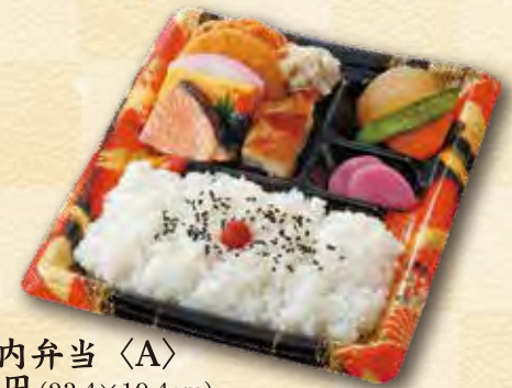
26 幕の内弁当〈A〉 600 円 (23.4×19.4cm)